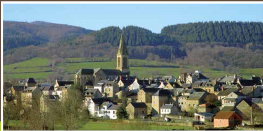
Village de Laissac