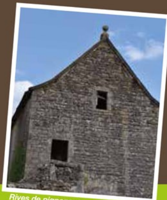
Rives de pignons en corniche de pierre. Épis de faîtage en pierre.