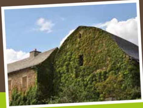
Toit à la Philibert Delorme