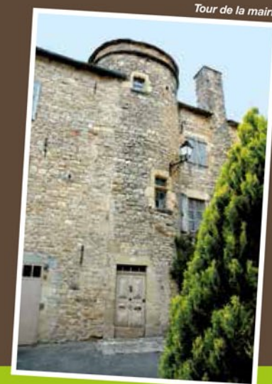
Tour de la mairie

Un fort, c'est-à-dire un ensemble de maisons fortifiées, dont les caves servaient de réserves de vivres lors des troubles et guerres de religion notamment, était situé autour de l'église démolie en 1900 (actuellement cour de récréation de l'école).